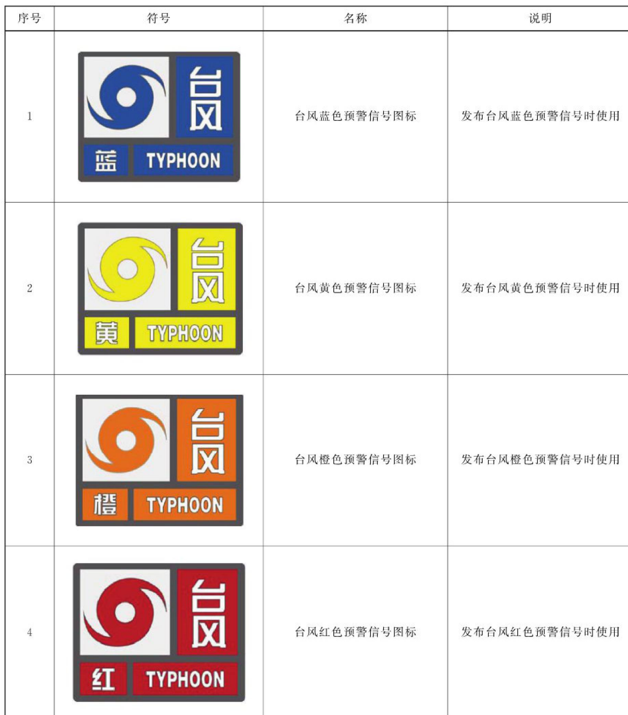
表 B.1 以台风预警颜色作为预警颜色使用实例